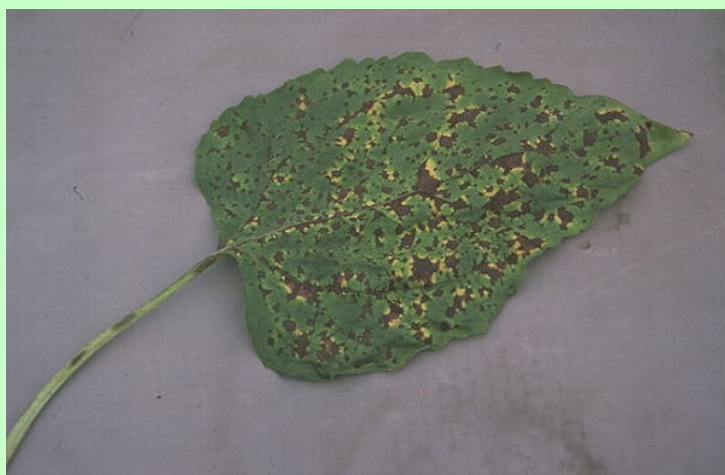
Macchie fogliari da Alternaria helianthii su girasole