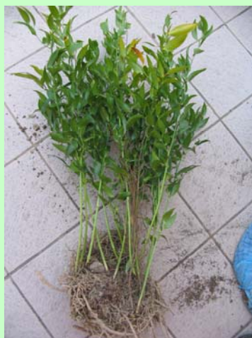
Rhizoctonia violaceae su ruscus