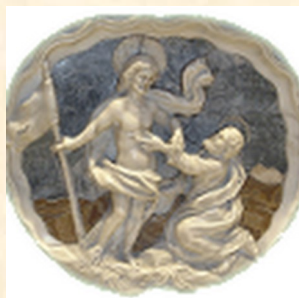
Parrocchia S. Tommaso Apostolo

Il Concerto è stato realizzato in collaborazione con: