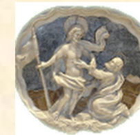
Parrocchia S. Tommaso Apostolo